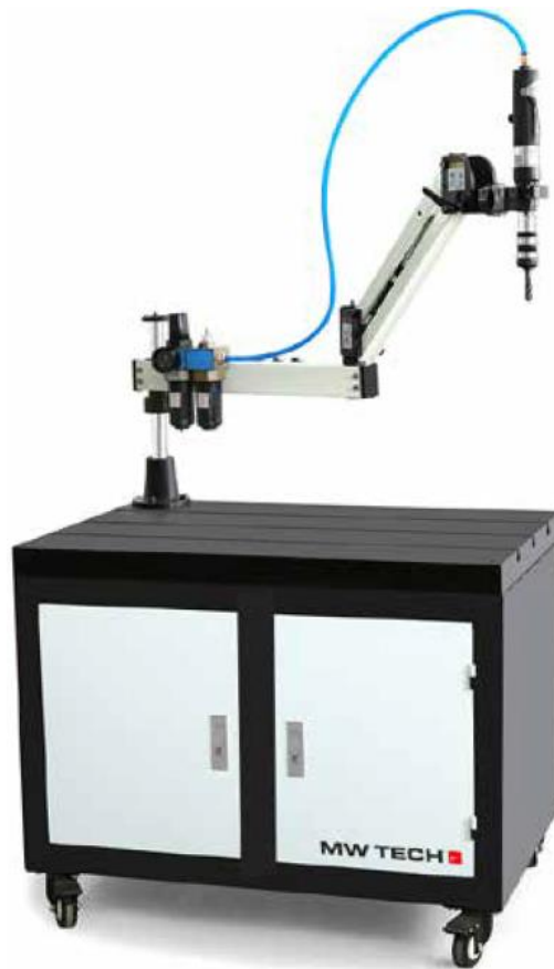
PTA1209HV avec établi (option)