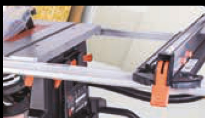
TABLE À RALLONGES

équipé de roues pour faciliter son rangement et assurer sa maniabilité