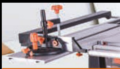
TABLE ET GUIDE D'ONGLET COULISSANTS

Les rallonges à gauche et à droite de la table permettent de soutenir les matériaux même les plus grands