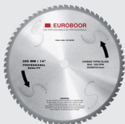
Zaagblad 66 tanden 130.355/66