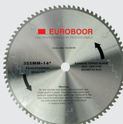
Zaagblad 80 tanden 130.355/80